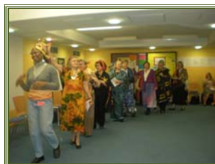
Einzug zum Gottesdienst