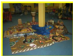
Gestaltete Mitte, mit Symbolen aus Afrika